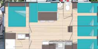
O'Phéa 784 B (7,80m x 4,00m)

De 2 à 5 personnes • 1 chambre lit 2 personnes • 1 chambre avec 1 lit superposé 2 ou 3 personnes