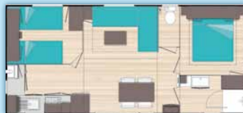
O'Phéa 834 (8,15m x 4,00m)

De 2 à 4 personnes • 1 chambre lit 2 personnes • 1 chambre 2 lits 1 personne