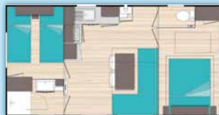
O'Phéa 734 (7,20m x 4,00m)

Un esprit très cosy pour se sentir comme à la maison.